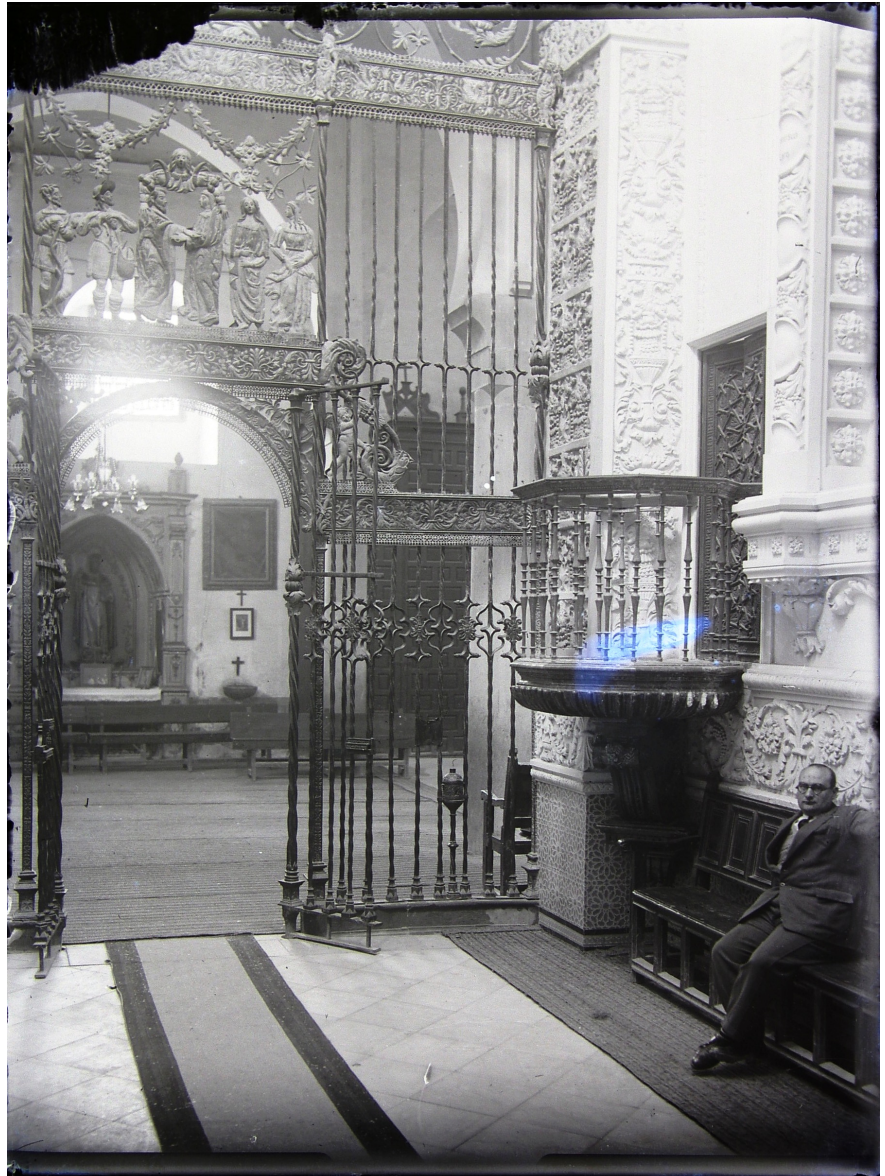
Antigua fotografía desde el interior de la Santa Capilla. Obsérvese al fondo el retablo de Sto. Domingo de Guzmán en su primitivo emplazamiento.