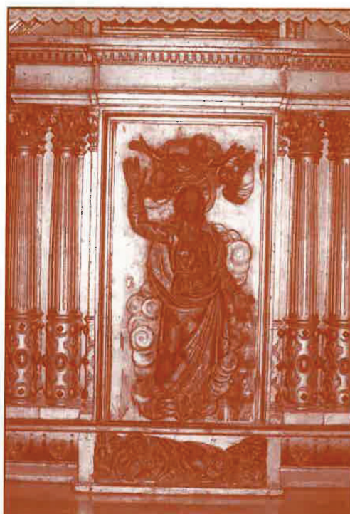
Artístico y valioso frontal de la mesa de altar en el presbiterio de la iglesia de San Andrés.