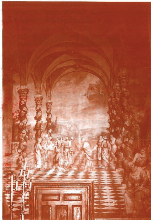
Lienzo de grandes dimensiones en el lateral derecho del presbiterio de la Santa Capilla. Representa la profecía de Simeón.