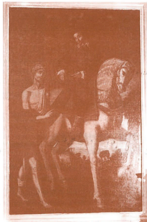
San Martín de Tours. Oleo sobre lienzo, de autor desconocido.

Preside el altar lateral derecho de la iglesia de San Andrés.