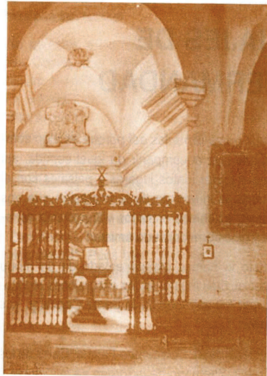
El desaparecido coro de S. Andrés